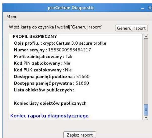
Rysunek 2: Wygenerowany raport w aplikacji proCertum Diagnostic

Wygenerowany raport można zapisać również do pliku o rozszerzeniu „txt” poprzez naciśnięcie przycisku Zapisz raport . Po naciśnięciu przycisku pojawi się okno dialogowe, w którym należy wskazać katalog docelowy i nazwę pliku z raportem.